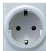
Schuko HU, DE, RU, AT, RO