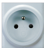
French CZ, SK, PL, FR

EAN код RFRP-20/F: 8595188145107 (French) RFRP-20 /S: 8595488145470 (Schuko) RFRP-20/B: 8595188145480 (British)